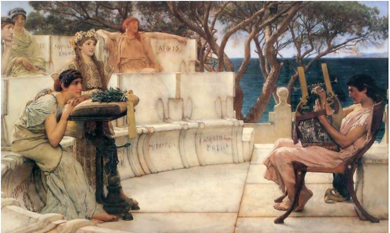
Mellékletek2: képek és videók (PPT formátumban bemutatott)